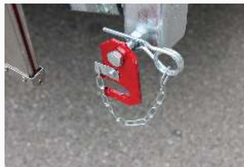
Verriegelung für abgeklappte Bordwand