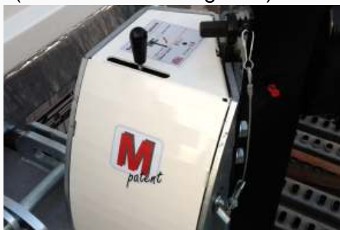
E-Hydraulik inkl. Funk