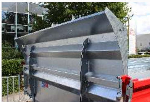
Schippe (Bordwanderhöhung vorn)