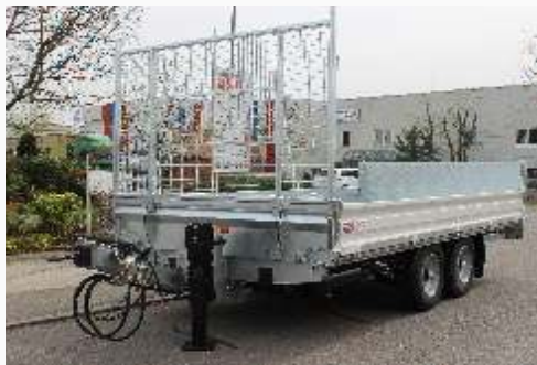
H-Gestell mit Gitter