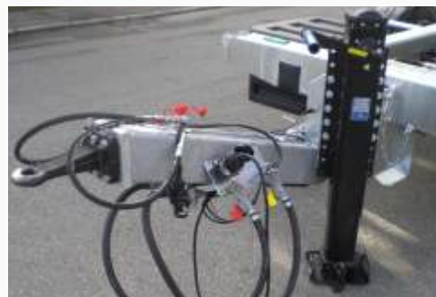
2 Gang Stützfuß